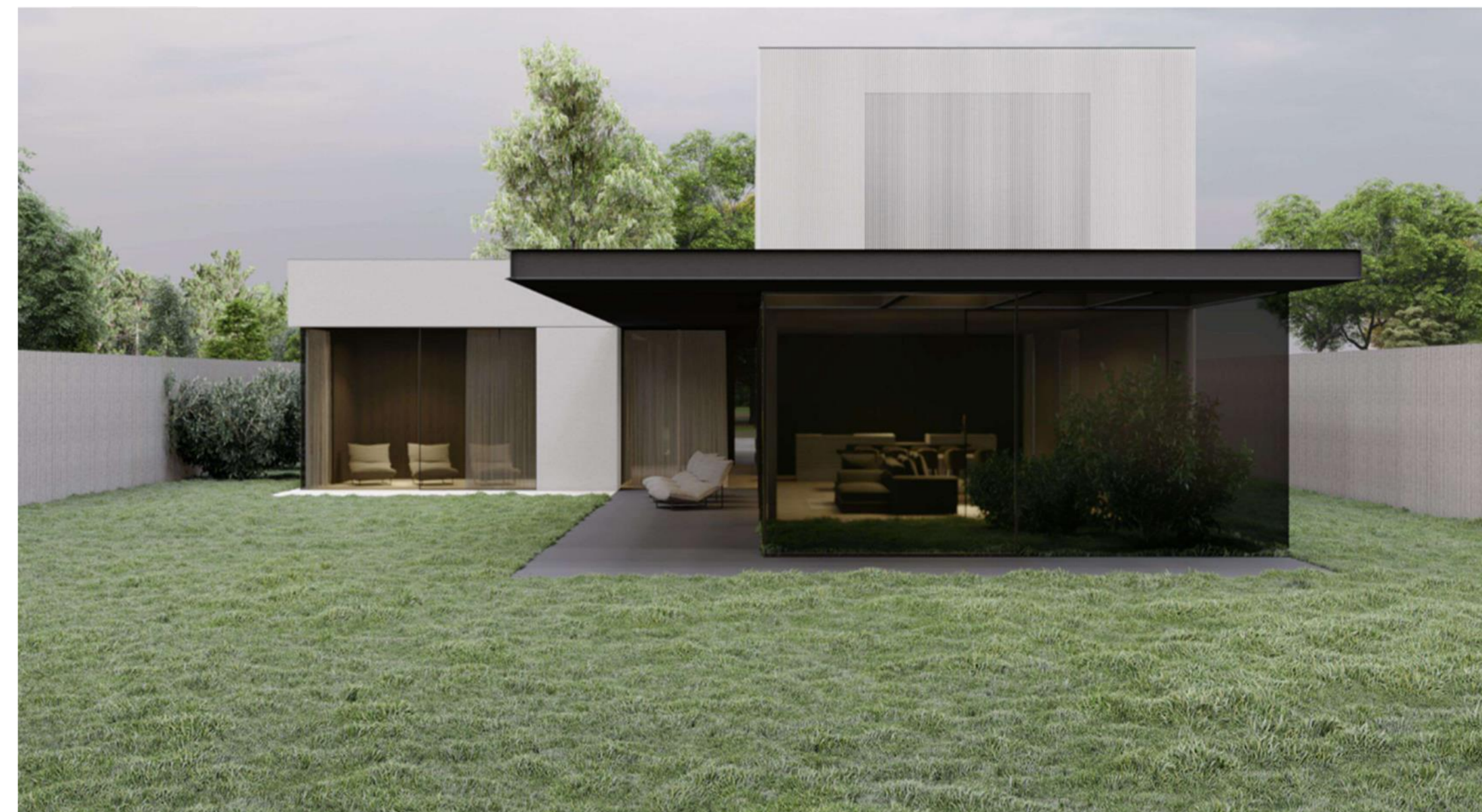
Vizualizácia: Tibor Grešo, Mária Žitňanský, Vladimír Šimkovič

Podrobnosti o požiadavkách na vnútorné prostredie budov a o minimálnych požiadavkách na byty nižšieho štandardu a na ubytovacie zariadenia sú definované vo Vyhláske č. 259/2008 Z. z. Vyhláska Ministerstva zdravotníctva Slovenskej republiky o podrobnostiach o požiadavkách na vnútorné prostredie budov a o minimálnych požiadavkách na byty nižšieho štandardu a na ubytovacie zariadenia, podľa §1, bod 2 p).