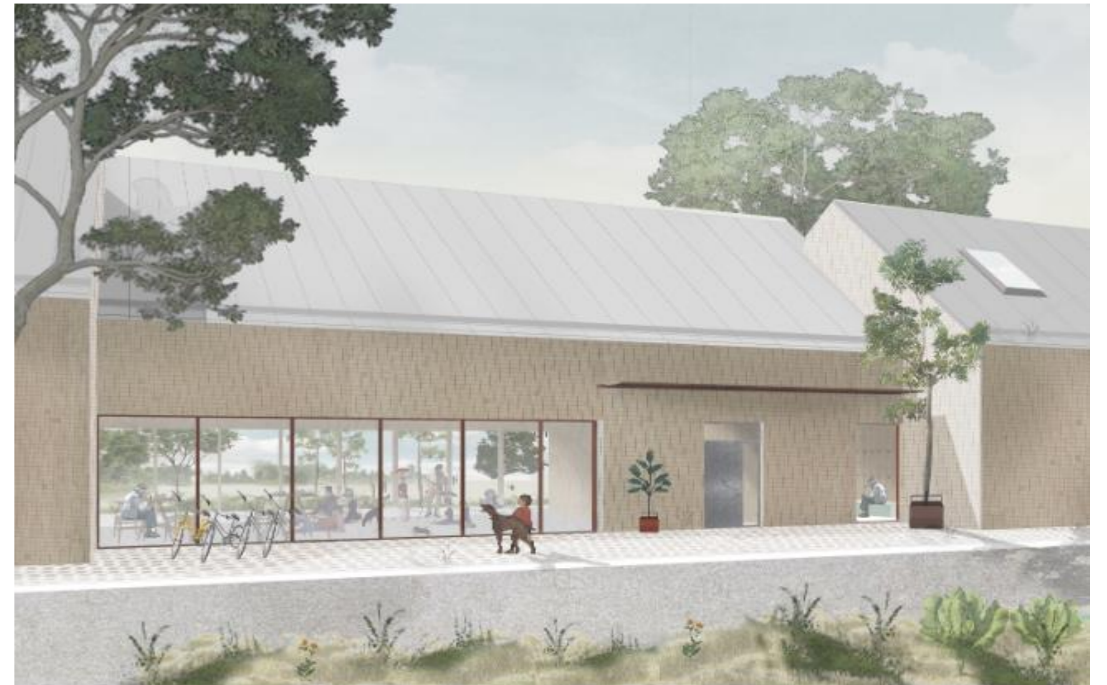
Vizualizácia: Alexander Schleicher, Marko Drozd, Paulína Dobrotová

Poskytovať službu v objekte minimálne 10 rokov po ukončení realizácie projektu