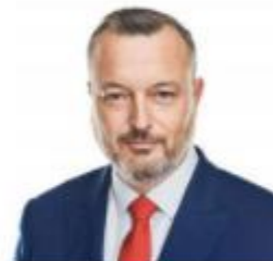
Bc. Milan Krajniak minister práce, sociálnych vecí a rodiny SR