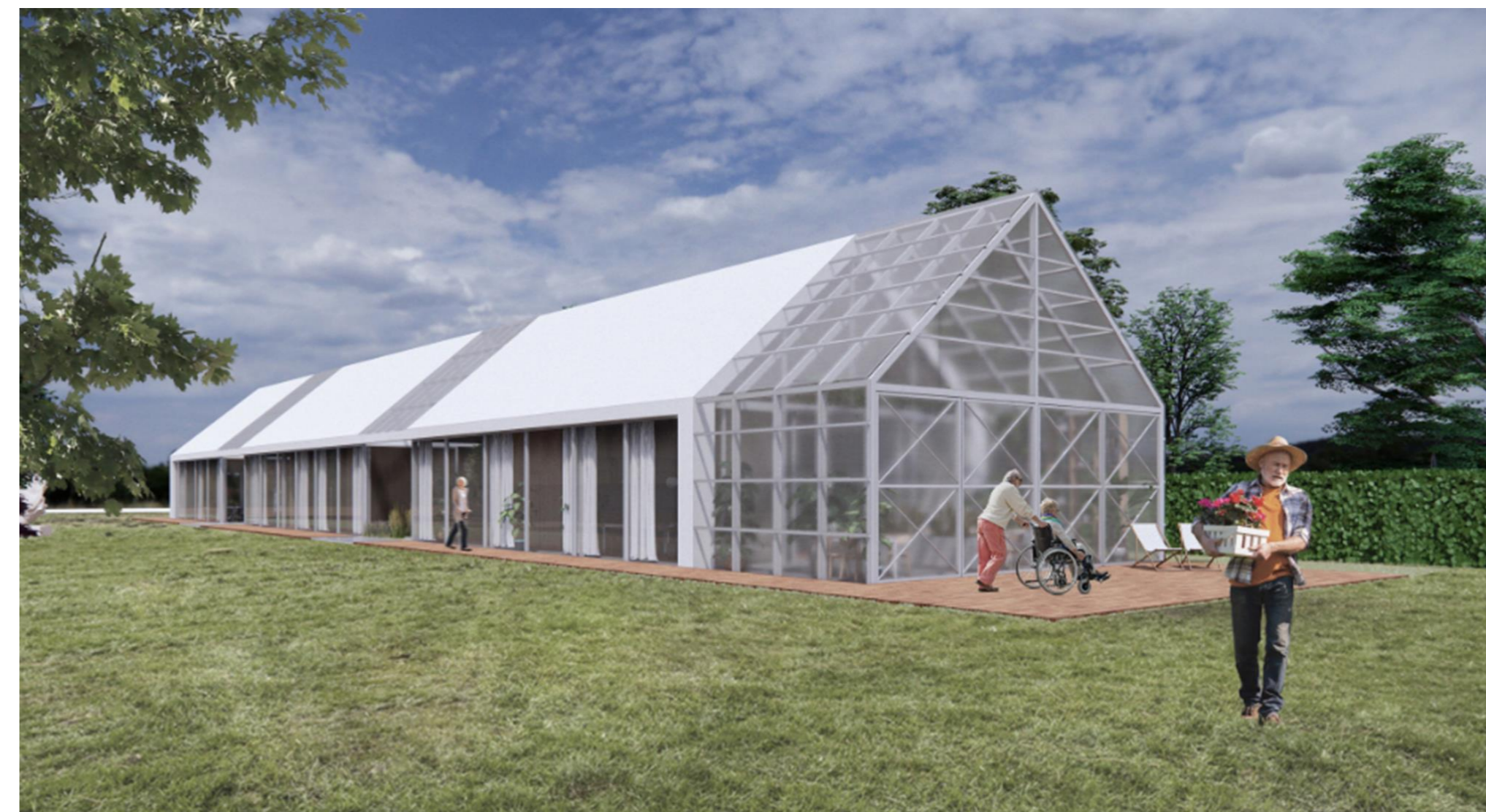
Vizualizácia: Jakub Čerešník, Samuel Andrejčák

Poskytovať službu v objekte minimálne 10 rokov po ukončení realizácie projektu.